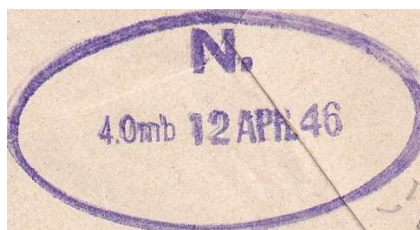
København N OMB-7. Kendt anvendt aug. 1945 og april 1946