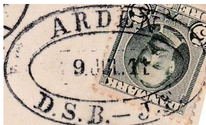
ARDEN/D.S.B. - J.F. OVA Kun kendt den 0.7.1911