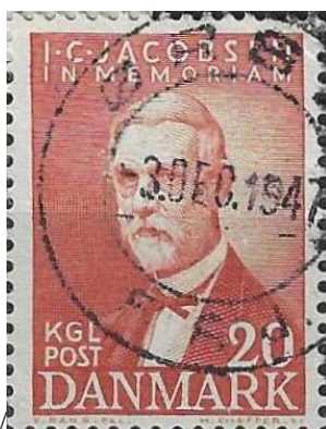
Ørsø. Fjerritslev-Frederikshavn Jernbane